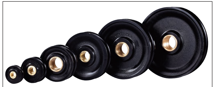
✓ Mit Bronzebuchse. With bronze bushing.