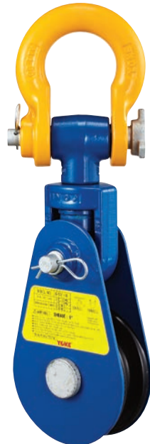
8-501-08 und größer and up