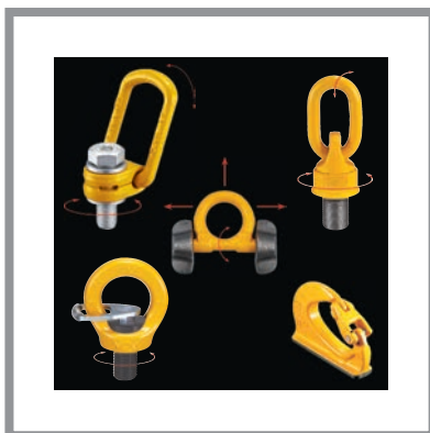
Anschlagpunkte Lifting Points