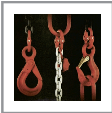
Ketten und Zubehör Güteklasse 8 (KU) Chains and Accessories Grade 80 (KU)