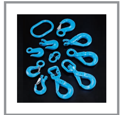
Ketten und Zubehör Güteklasse 10 Chains and Accessories Grade 100