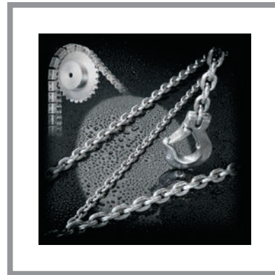
Rostfreie Ketten Stainless Steel Chains