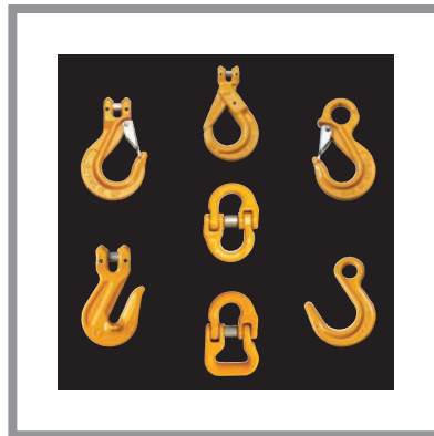
Ketten und Zubehör Güteklasse 8 (Yoke) Chains and Accessories Grade 80 (Yoke)