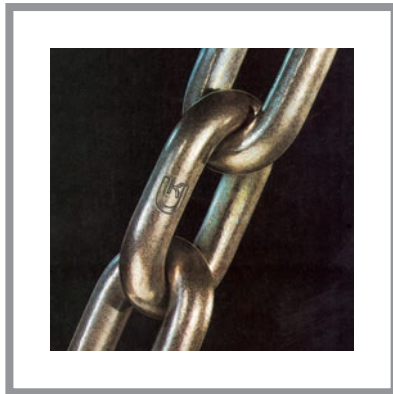
Anschlagketten/Hebezeugketten Sling Chains/Hoist Chains